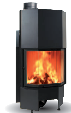
DRZWICZKI PRYZMATYCZNE GILOTYNOWE

Ogrzewa do 90 m 2 Zużycie drewna 3 kg/godz