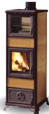
CERAMIKA MIODOWA Z PIECEM