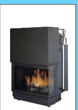
Szyba narożna model 29 cm 99x80x138h