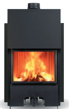
DRZWICZKI PROSTE GILOTYNOWE

Ogrzewa do 90 m 2 Zużycie drewna 3 kg/godz