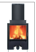
Drzwiczki PROSTE na zawiasach cm 80x61x185h