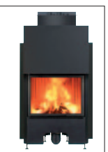
Drzwiczki PROSTE gilotypnowe cm 92x65x185h