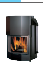
Szyba przyrmatyczna model 22 cm 75x68x138h model 29 cm 92x80x138h