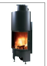
Drzwiczki PÓŁOKRĄGŁE gilotypnowe cm 84x67x185h