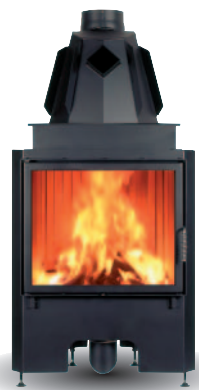
DRZWICZKI PROSTE NA ZAWIASACH

Ogrzewa do 90 m 2 Zużycie drewna 3 kg/godz