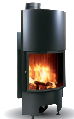
DRZWICZKI PÓŁOKRĄGŁE GILOTYNOWE

Ogrzewa do 90 m 2 Zużycie drewna 3 kg/godz