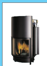
Szyba Okrągła model 22 cm 74x76x138h