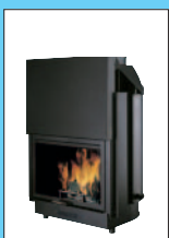
Szyba Prosta model 22 cm 80x68x138h model 29 cm 99x80x138h