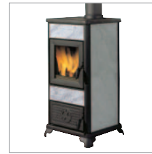
OBUDOWA ZE STEATYTU BEZ NADSTAWKI

Ogrzewa do 80 m 2 Zużycie drewna 2,6 kg/godz