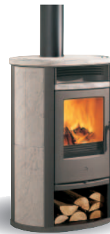
OBUDOWA ZE STEATYTU