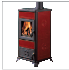
CERAMIKA BORDOWA BEZ NADSTAWKI