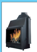
Idro 50 cm 79x64x138h

SERIA THERMOFIRE (z drzwiczkami na zawiasach i podnoszonymi)