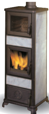
OBUDOWA ZE STEATYTU Z PIECEM