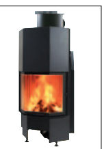
Drzwiczki PRYZMATYCZNE gilotypnowe cm 84x66x185h